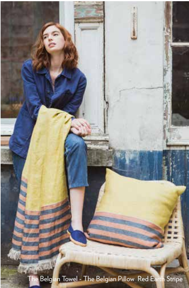
The Belgian Towel - The Belgian Pillow Red Earth Stripe