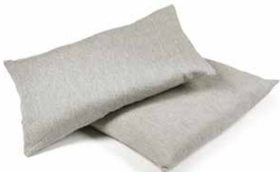
The Workshop Stripe