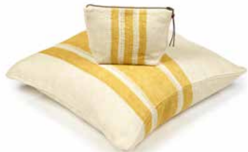
The Belgian Pillow - The Belgian Pouch