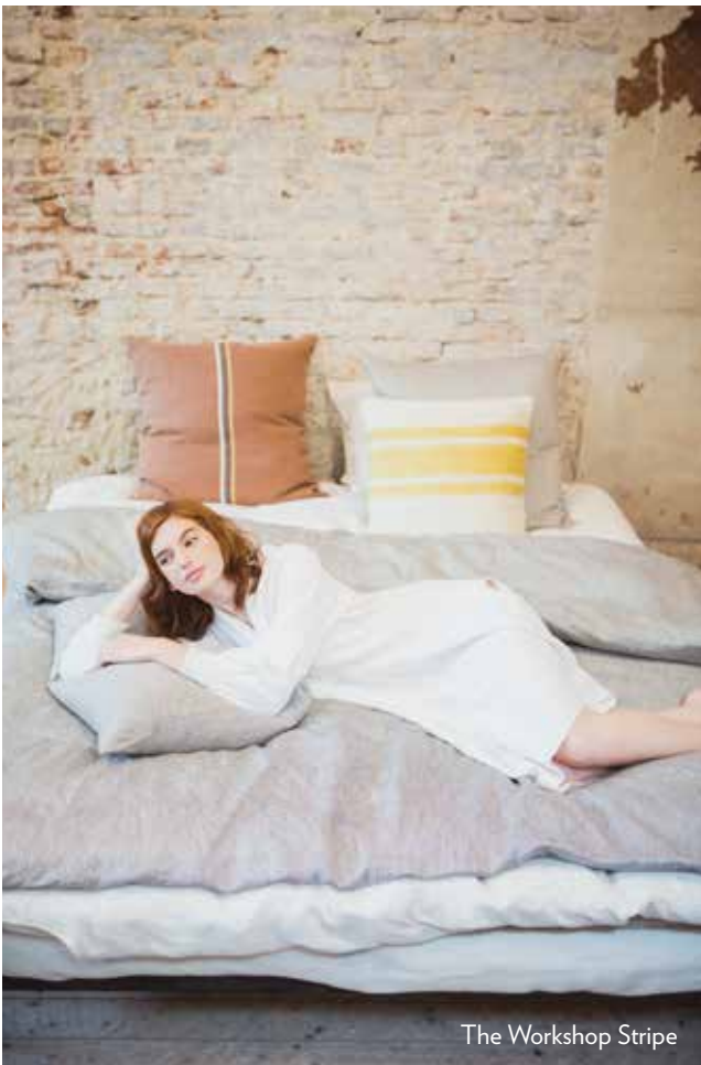
The Workshop Stripe