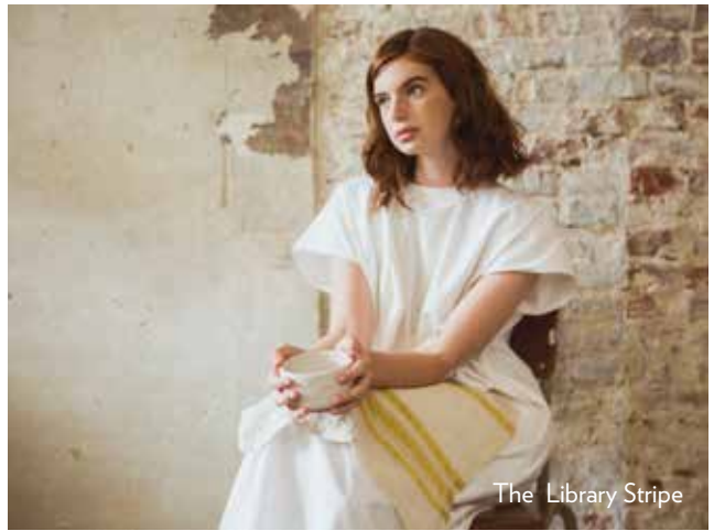
The Library Stripe