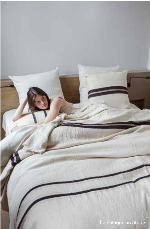
The Patagonian Stripe