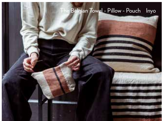
The Belgian Towel - Pillow - Pouch Inyo