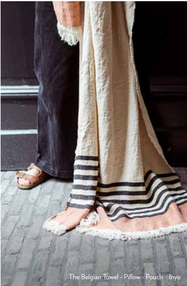
The Belgian Towel - Pillow - Pouch Inyo